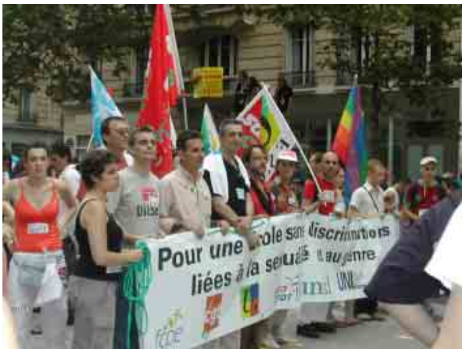
Marche des Fiertés 2005

Ce qu'il pourrait faire, en tout cas, c'est assurer dans ses murs, le mieux-être de milliers de jeunes, qui, aujourd'hui, à l'école comme ailleurs, ne sont pas à l'abri des stéréotypes et des discriminations .