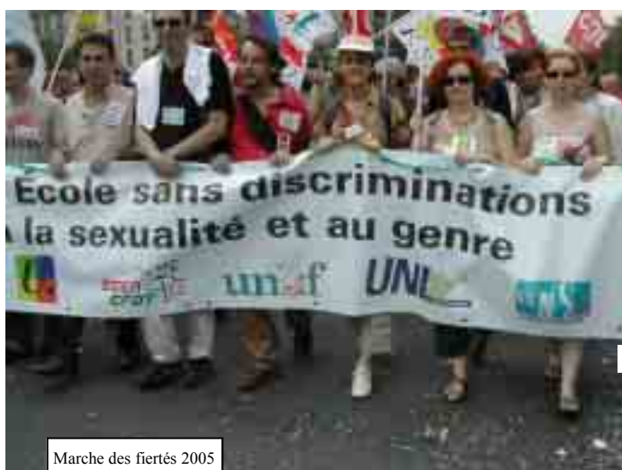
Marche des fiertés 2005

Vit dans un espace clos Appelé ghetto Oh, oh!!