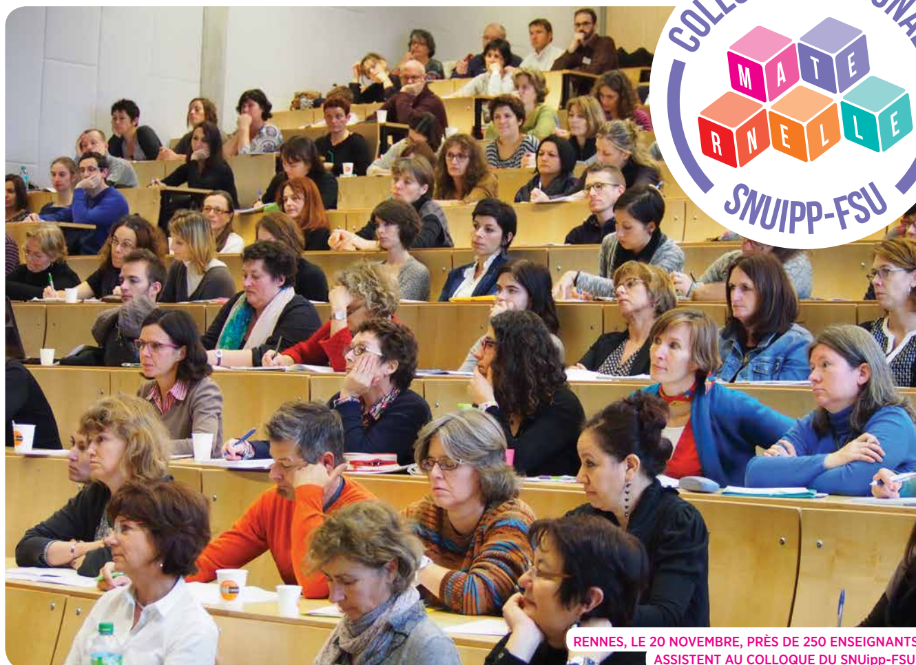
RENNES, LE 20 NOVEMBRE, PRÈS DE 250 ENSEIGNANTS ASSISTENT AU COLLOQUE DU SNUipp-FSU.

Aujourd'hui, il est temps de redonner à la maternelle de la sérénité, une identité, un cap et des moyens. Après avoir été bousculée sur ses bases, remise en cause y compris par des ministres adeptes des coups de « couches culottes », soumise à des injonctions paradoxales qui ont conduit à une « prima-ri-sation » contreproductive notamment vis-à-vis des élèves les plus fragiles, une nouvelle séquence s'ouvre. La maternelle sera cadrée par un cycle unique et de nouveaux programmes sur lesquels les enseignants ont été consultés sont en cours de finalisation. Ce sont des signes positifs mais on ne change pas l'école à coup de lois et de circulaires. Il faut aussi donner aux