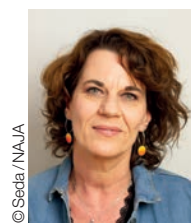
© Seda/NAJA POUR LES SERVICES PUBLICS

Avec un gouvernement qui renoue avec les suppressions de postes sarkozystes, une ministre de l'Éducation qui poursuit une politique éducative très largement rejetée et considère que les enseignant-es ont déjà été revalorisé-es, un ministre de la Fonction publique qui s'affiche proche d'Elon Musk dans sa détestation de l'État et considère qu'il est normal de faire payer aux salarié-es le fait d'être malade, la colère doit se faire entendre.