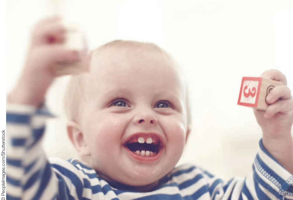
SELON L'ÉTUDE, le regard des bébés est corrélé à l'activité cérébrale.

MONTRE QUE LES JEUNES EXPOSÉS À LA PRÉCARITÉ SONT 1,5 FOIS PLUS SUSCEPTIBLES DE SORTIR DU SYSTÈME ÉDUCATIF AVEC LE BREVET OU MOINS. POUTRANT, LE PARCOURS SCOLAIRE S'AVÈRE UN «ÉLÉMENT PROTECTEUR» VIS-À-VIS DE LA PAUVRETÉ À L'ÂGE ADULTE.